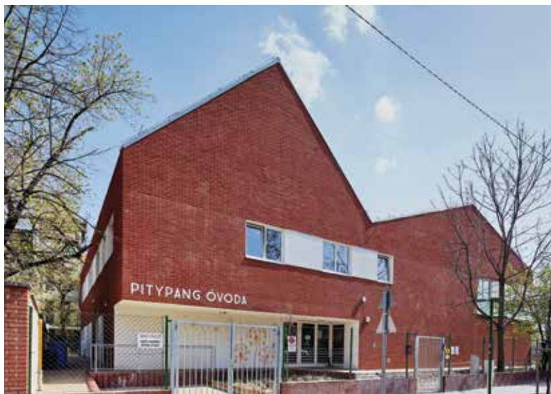
Pitypang Óvoda, Budapest, VIII. kerület

Az építészársadalomnak pedig egységet kell alkotnia, amely szakmai alapokon nyugszik, elismerve a kiemelkedő alkotók munkáját és nyitottan maradni a világra. Nem kell kompromisszumokat kötni a vizuális kultúra és a fenntarthatóság terén.