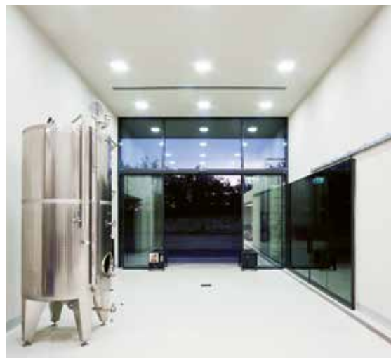
Üzemi bejárat a HOLDVÖLGY Borászatban

Az építésznek nem kell minden dologhoz értenie, de vajon Önök kedvelik-e a jó borokat? Ha igen, milyen?