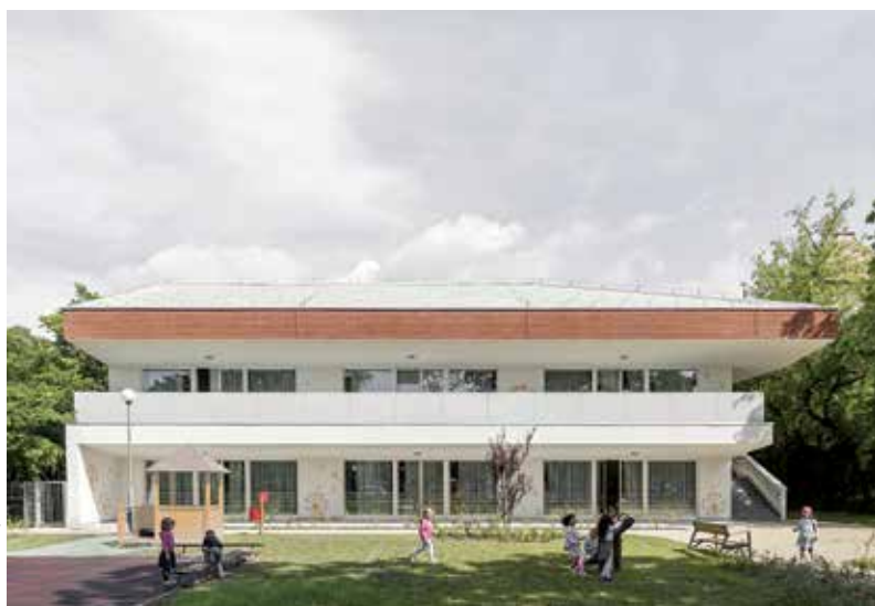
Pitypang Óvoda, Budapest, VIII. kerület

A borászatok, amiket terveztünk mind természetes táji környezetben épültek vagy vidéki környezetbe illeszkednek, ahol élnek és erősek a helyi épített hagyományok. A borász megbízóinknak nagyon erős a kötődése a helyhez, a természethez, a szőlőterek közelében élnek, a borkészítés az életük. Rajtuk keresztül és a táji környezet hatására mi is egyre jobban megismertük a szőlőtermesztést és a borkészítést, kicsit mi is ott élhettünk a borászat közelében, megérettük ennek