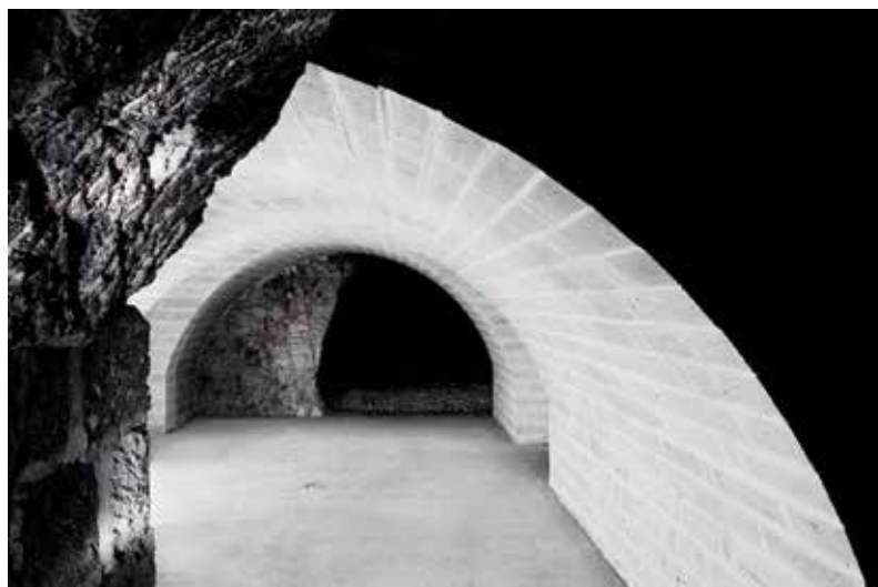
A két kilométer hosszú többszintes pincelabirintus felújított tere a HOLDVÖLGY Borászatban