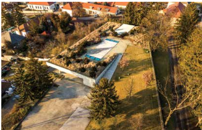
A HOLDVÖLGY Borászat tömege a lejtőre ékelve illeszkedik a védett településképhe

A HOLDVÖLGY stúdiókn legelső borászati projektje Mád településen belül, világörökségi területen épült meg. A kiemelten védett épített környezet miatt az épületet a lejtős domboldalba ékelve terveztük. A szabályosan szerkesztett egyszerű tömeg tiszta, semleges átmenetet képez a föld mélyén rejtőző két kilométer hosszú ősi pincelabirintus és a felszín felett kialakított csodás park között. Az épület múzeumi minőségű belső tereivel helyezi középpontba a borkészítés legkorszerűbb technológiáját.