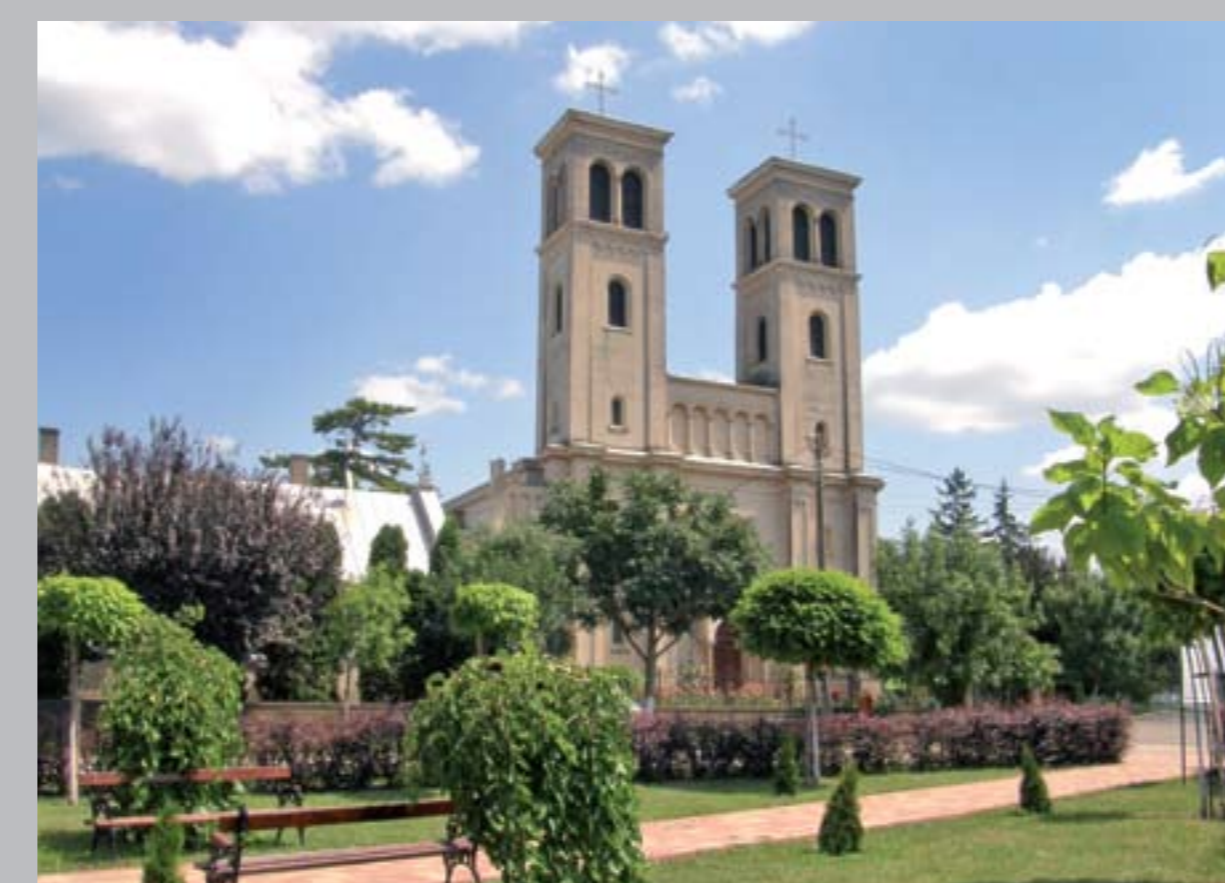
○ Plébániatemplom, 1842–47 KAPLONY, ROMÁNIA