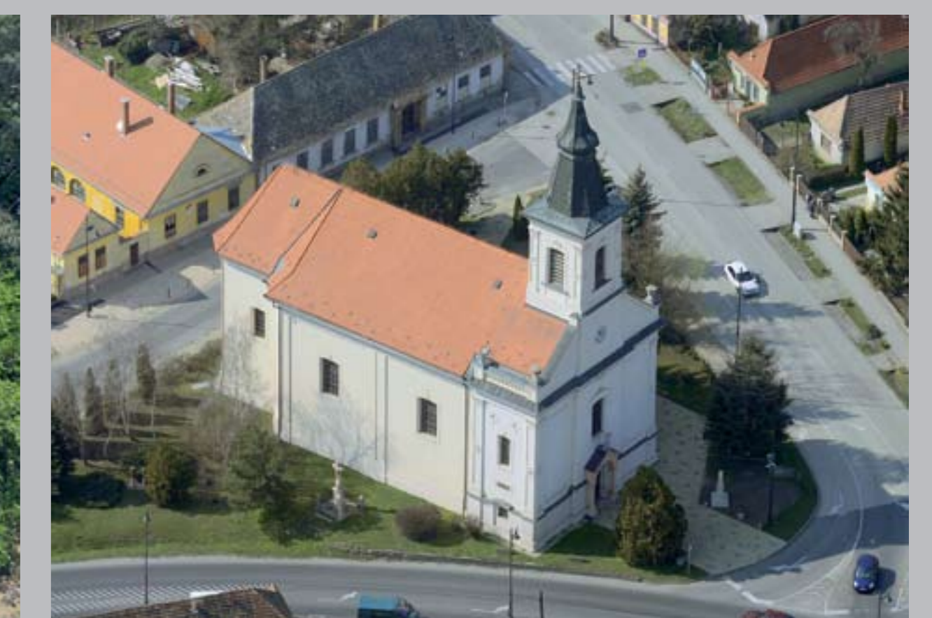
○ Római katolikus templom, 1867 KÖRNYE