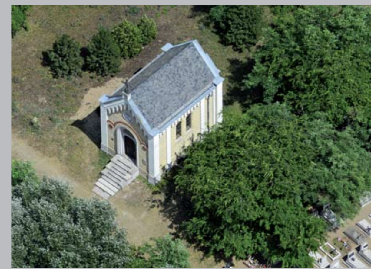
○ Szapáry síremlék, 1860 ALBERTIRSA

Szöveg: Lechner Lajos Tudásközpont Nonprofit Kft.