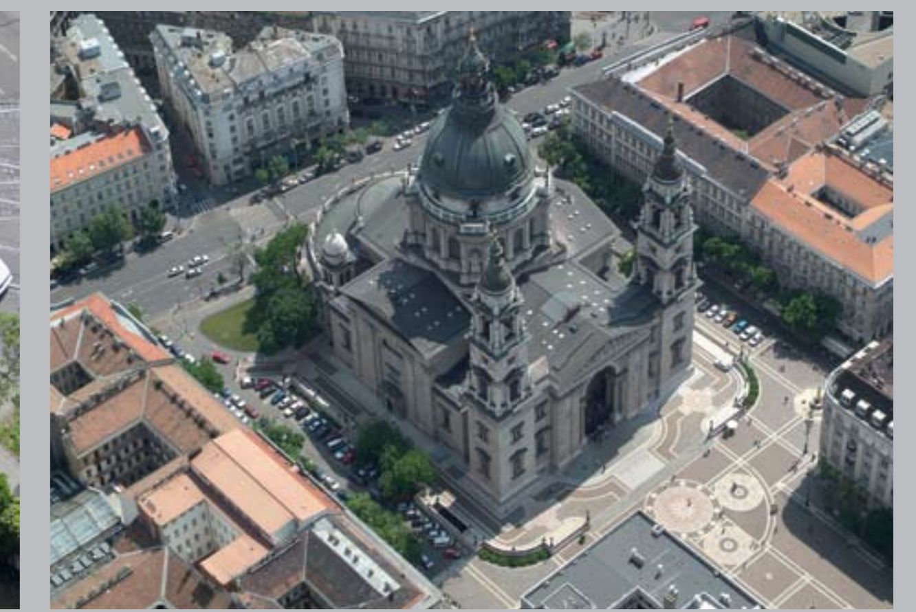
○ Lipótvárosi Szent István templom 1867–91 BUDAPEST, SZENT ISTVÁN BAZILIKA