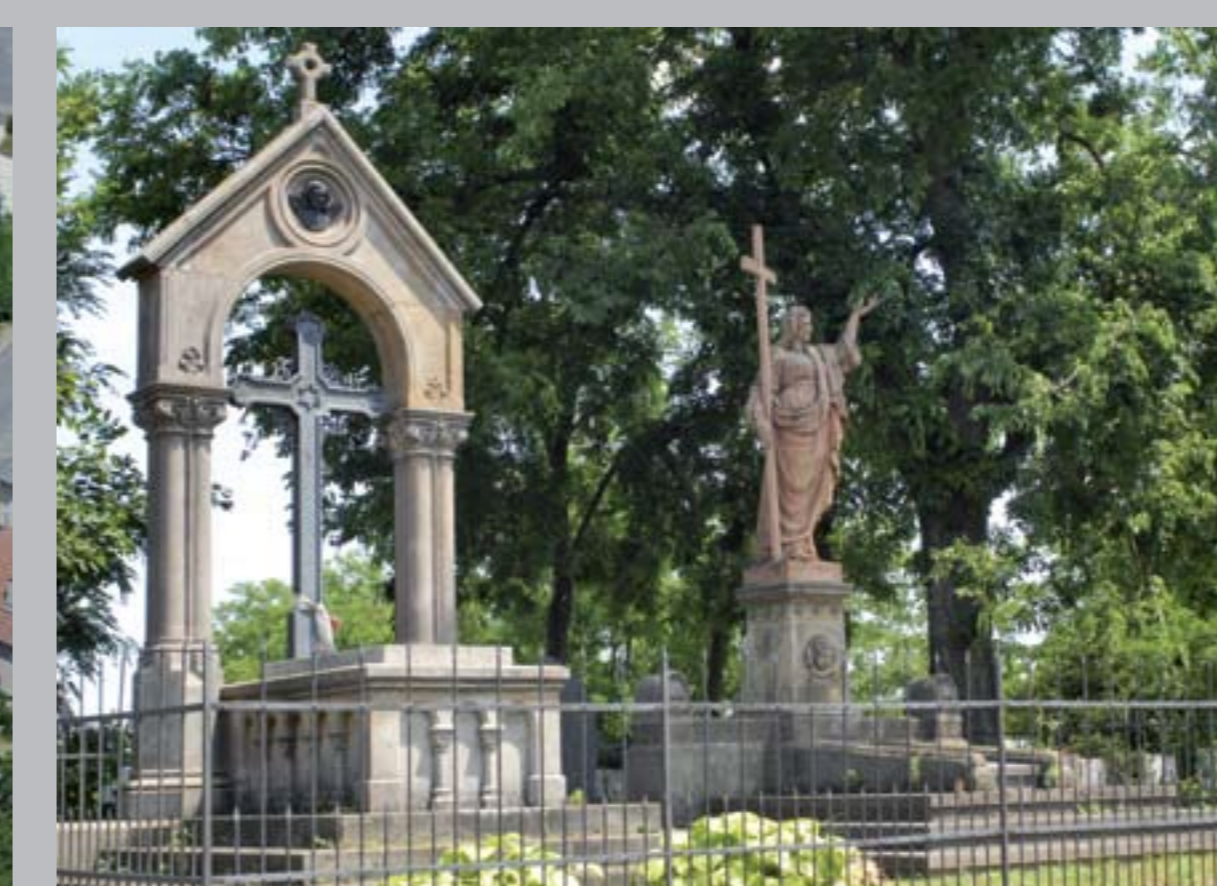
○ Pollack Mihály síremlék, 1857 TAHITÓTFALU