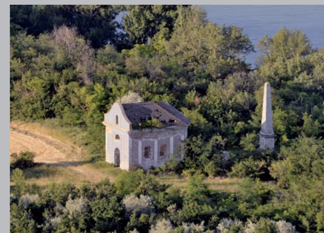
○ Eötvös József obelisz, 1879 ERCSI