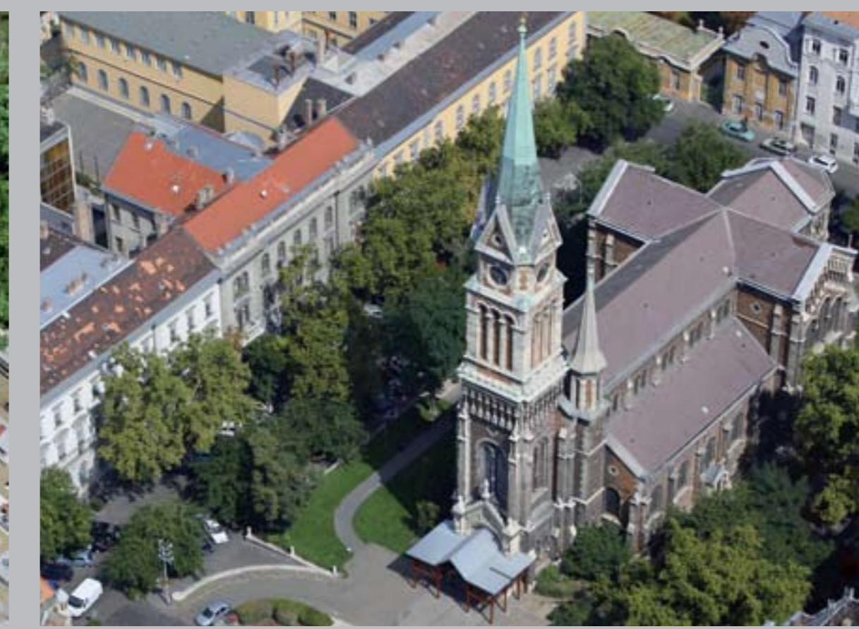
○ Ferencvárosi római katolikus Plébániatemplom, 1867–79 BUDAPEST, BAKÁTS TÉR (Assisi Szent Ferenc Plébániatemplom)