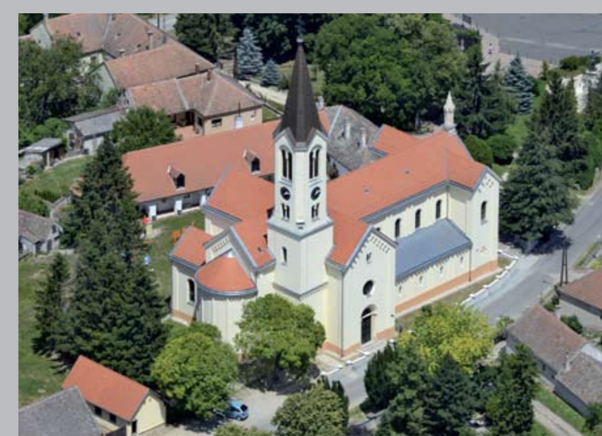
○ Római katolikus templom, 1860–64 NAGYCENK