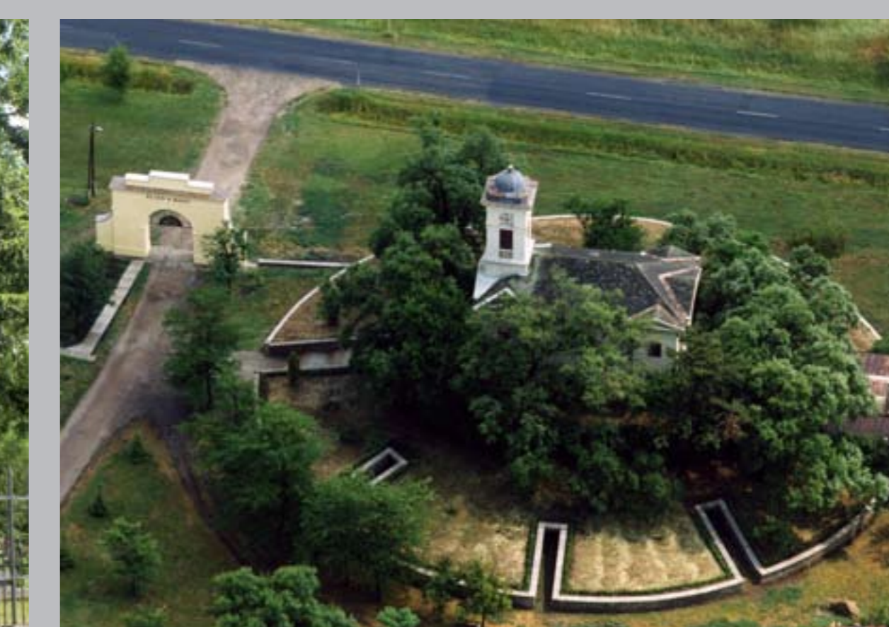
○ Wenckheim kripta és kastélykápolna, 1850 SZABADKÍGYÓS