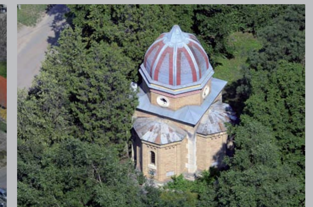
○ Sztankovánszky mauzóleum, 1891 KAJDACS