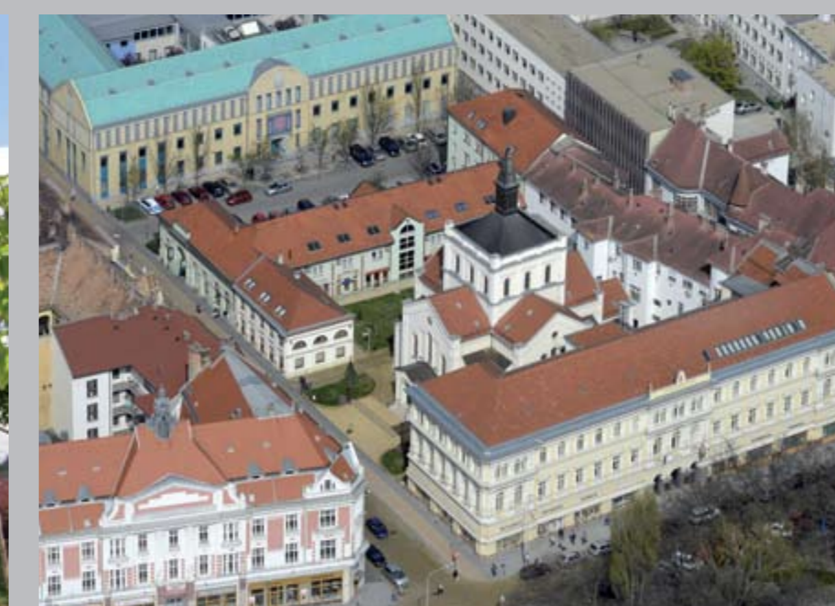
○ Evangélikus templom, 1862–65 KECSKEMÉT