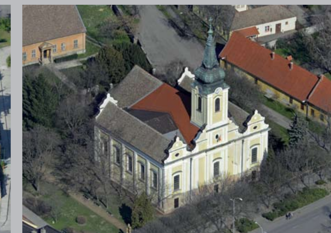
○ Belvárosi római katolikus templom, 1860 HÓDMEZŐVÁSÁRHELY (Szentháromság templom)