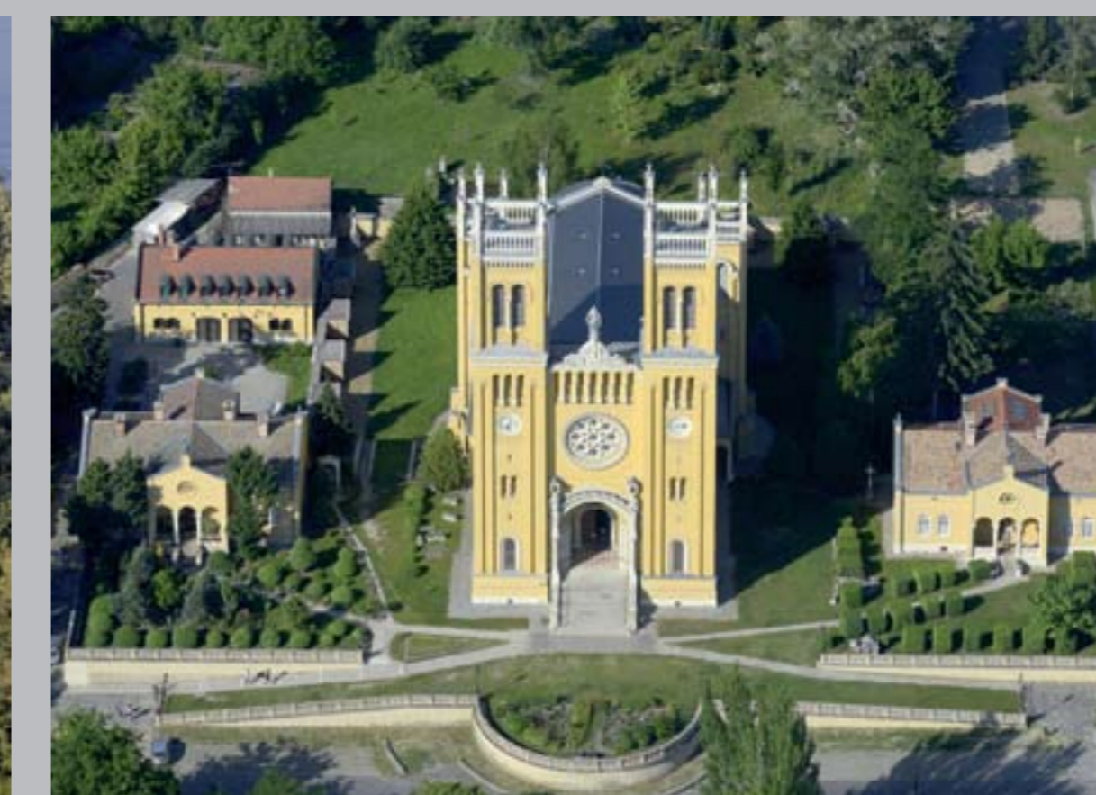
○ Római katolikus Plébániatemplom, 1845–55 Plébánia és zárdaépület, 1845 FÓT