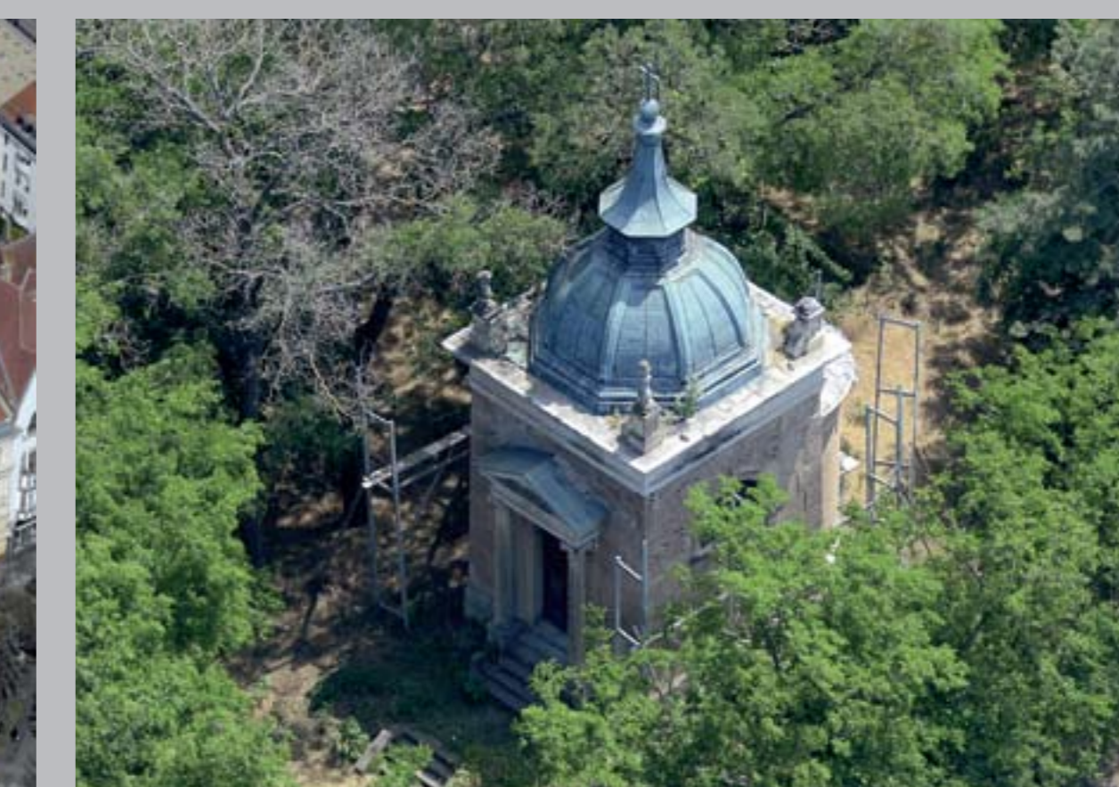
○ Batthyányi-Geist mauzóleum, 1864 KONDOROS