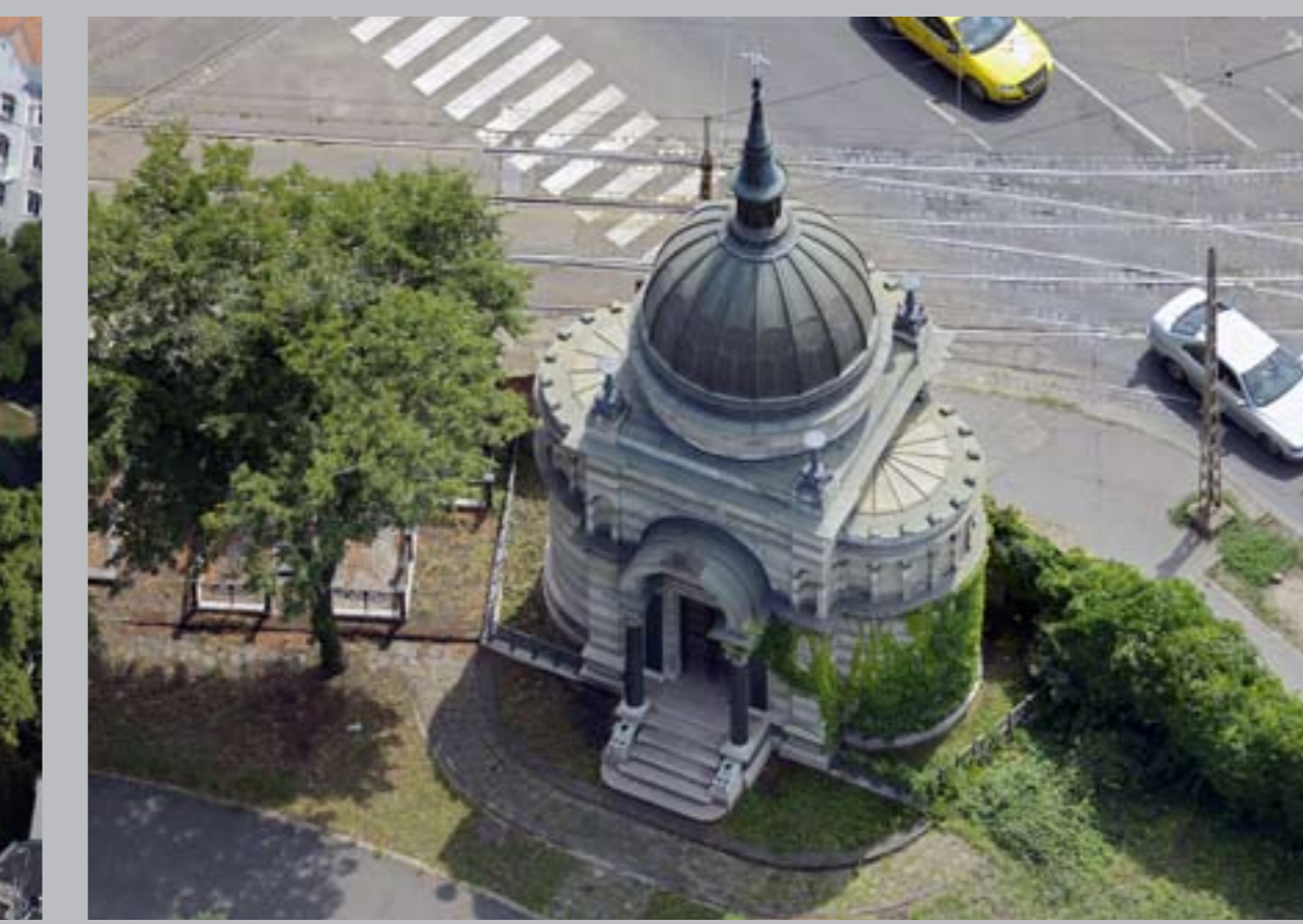
○ Ganz Ábrahám mauzóleuma, 1868 BUDAPEST, KEREPESI TEMETŐ (Fiumei úti Nemzeti Sírkert)